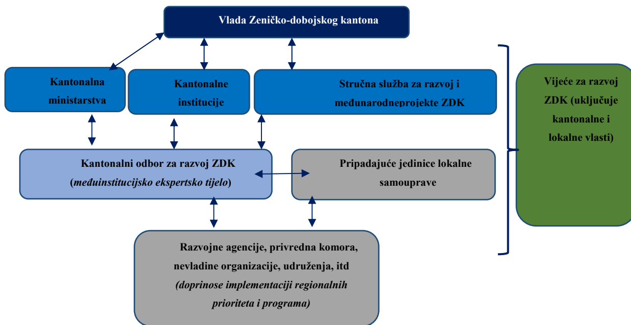
Slika 3 Integrirani sistem upravljanja razvojem u Zeničko-dobojskom kantonu

usklađivanje strateškog planiranja i budžetskih procesa, kao i sistemsku implementaciju, monitoring i evaluaciju razvojnih ciljeva. Sistem za upravljanje razvojem će definisati odgovorne institucije, mehanizme partnerstva i ključne korake procesa te time omogućiti efektivniju i efikasniju javnu upravu, razvoj orijentisan na rezultate i optimalne apsorpcijske kapacitete za korištenje eksternih finansijskih resursa.