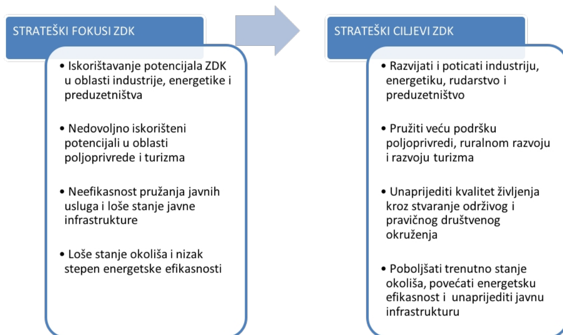
Slika 1 Strateški ciljevi za period 2016.-2020. godina

Definisani strateški ciljevi predstavljaju pravac djelovanja ključnih sektora u Zeničko-dobojskom kantonu kako bi se postigle pozitivne promjene na ključnim razvojnim indikatorima u oblastima ekonomije, društva i okoliša. Ocjena trenutnog stanja i kretanja razvoja Zeničko-dobojskog kantona će se upravo posmatrati kroz stepen ostvarenja strateških ciljeva i njihovog doprinosa